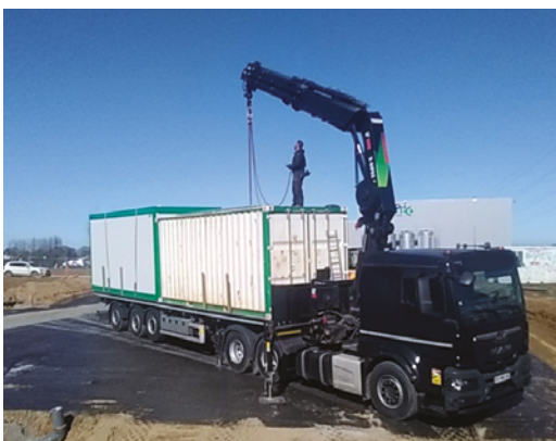
LORS DU CHARGEMENT/ DÉCHARGEMENT DU CAMION