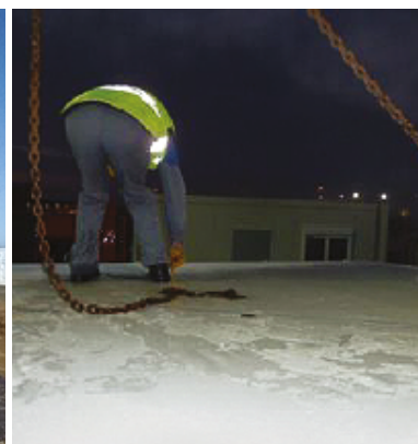
LORS DE L'INSTALLATION DES BRANCHEMENTS