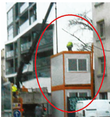
LORS DE LA SUPERPOSITION DES BUNGALOWS

Installation des bungalows sans garde-corps en toiture.