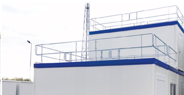
Garde-corps à demeure rabattables et relevables du sol.

Les garde-corps rapportés ou intégrés servent pendant le levage : ils restent en place pour accrocher et décrocher les anneaux de levage en sécurité et pendant les opérations de raccordement des réseaux.