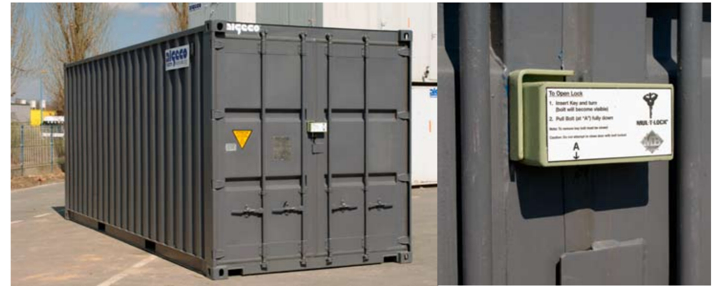
Serrure de sécurité exclusive Algeco

Abonnez-vous à Algeco Actualité sur : www.algeco.fr